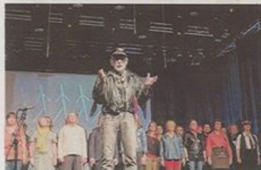
« Ce qu'on ne voit jamais dans ma cité, c'est un regard qui nous regarde ! », s'écrie le blouson noir.

LORGIES. L'espace Dellouze de Billy-Montigny a offert à Cap Chœur, ce samedi, une vraie scène et une vaste salle, comble et enthousiaste. Très vite, la chorale lorginoise a témoigné sa maîtrise, sa sensibilité et sa délicatesse en offrant une version très émouvante de la chanson de Cabrel Hors-Saison. « Une ville se fane dans les brouillards salés, la colère océane est trop près », a-t-elle tonné en s'envolant dans les aigus.