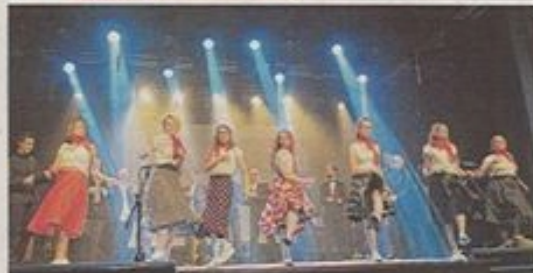
En haut : après l'ardeur du slam, la grâce d'un cabaret. En bas : quelques onomatopées bien senties, et le swing est là !