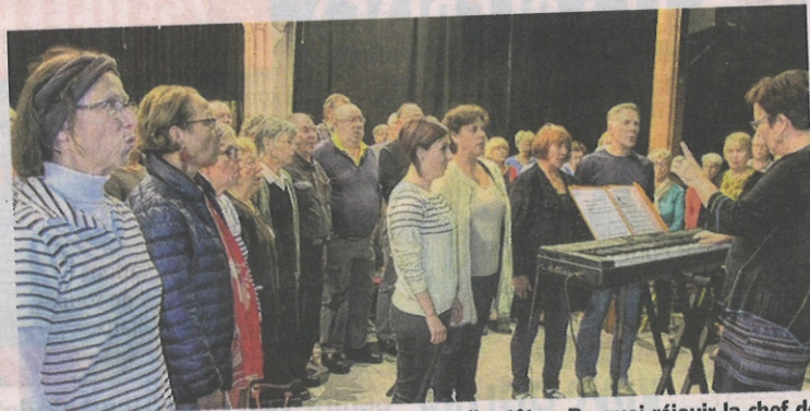
Dans les rangs de la chorale, quelques nouvelles têtes. De quoi réjouir la chef de chœur et le président.