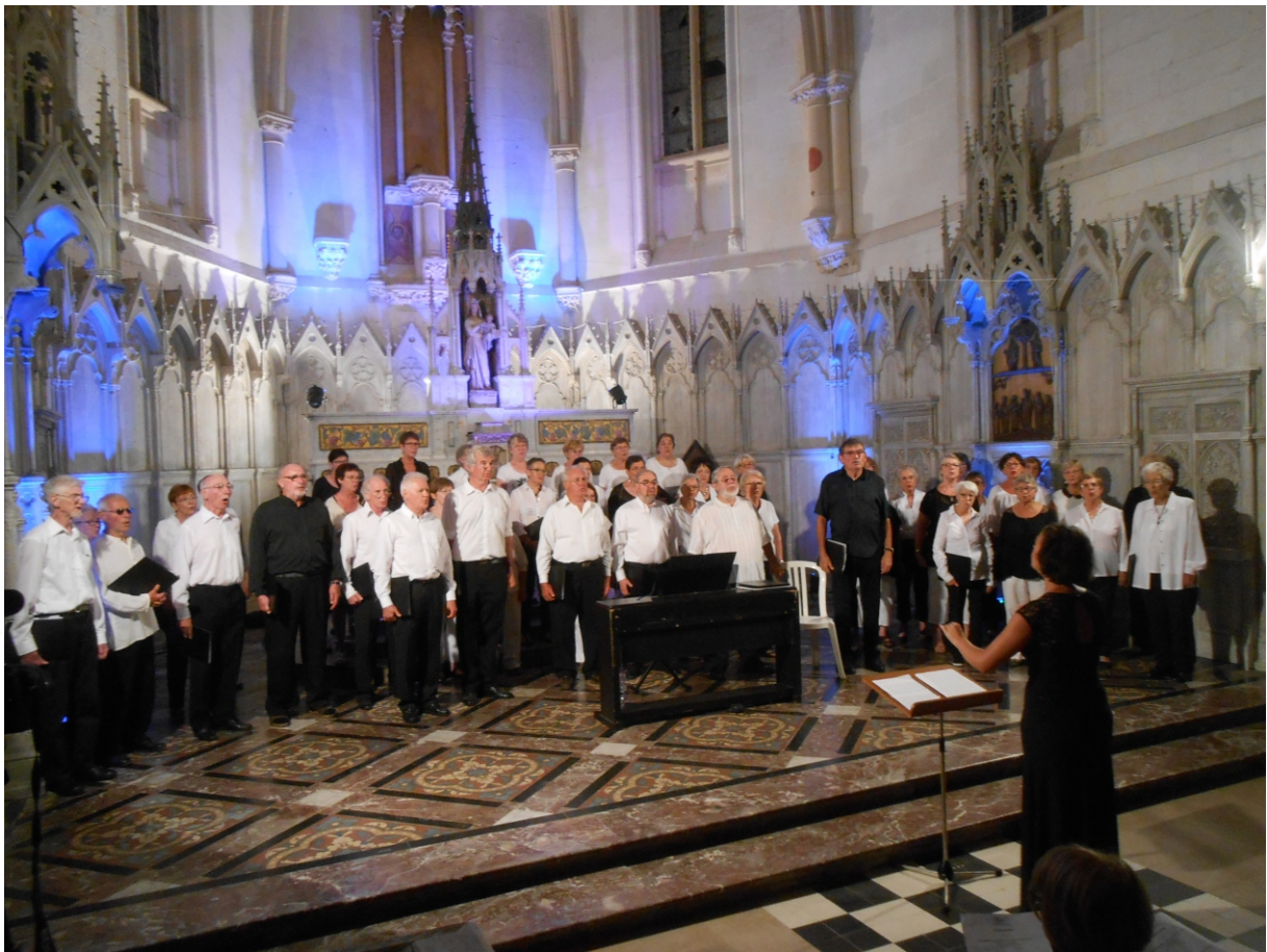
Concert à la Chartreuse de Neuville sous Montreuil le 26 août 2016