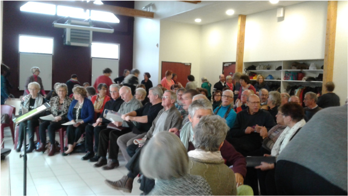
Répétition chants communs pour Multiphoniades le 13 novembre 2016 à Drouvin le Marais