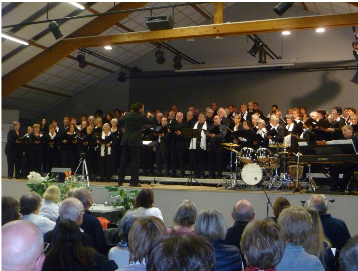
Concert atelier « Paix, Justice, Liberté » à Beuvry le 15 octobre 2016