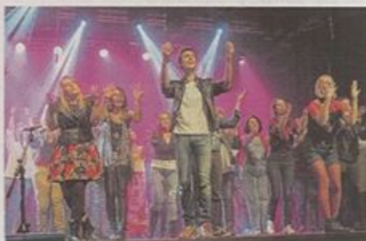
« Je dis M, Comme un emblème, La haine je la jette ! » La réponse de Cap Chœur à l'indifférence et à la violence.