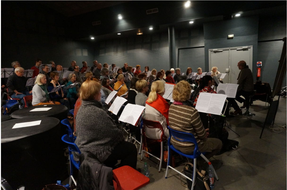
Stage « Baroques » à Auchel organisé par la chorale Chœur à Coeur