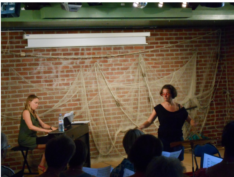
Répétitions positions normales et avec pianiste