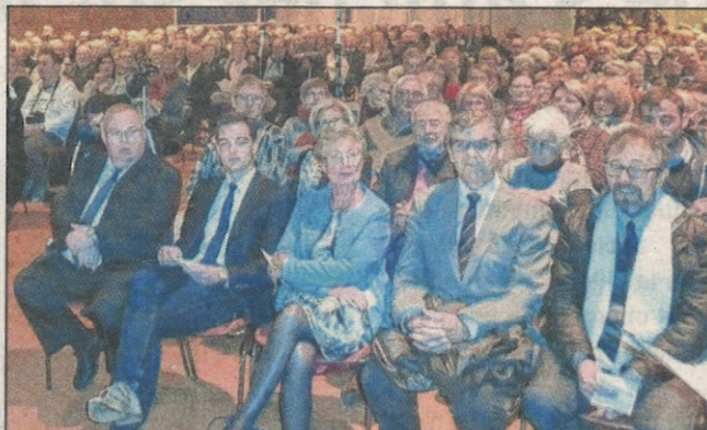
Un public de mélomanes avertis a écouté les 150 choristes.