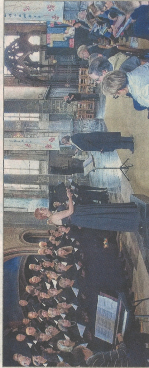
Le concert donné dimanche après-midi dans la collégiale Saint-Pierre a bénéficié de l'acoustique exceptionnelle du lieu.