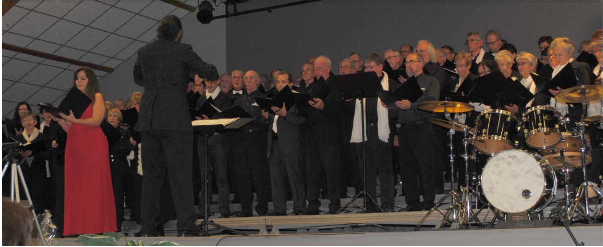
Concert atelier « Paix, Justice, Liberté » à Beuvry le 15 octobre 2016