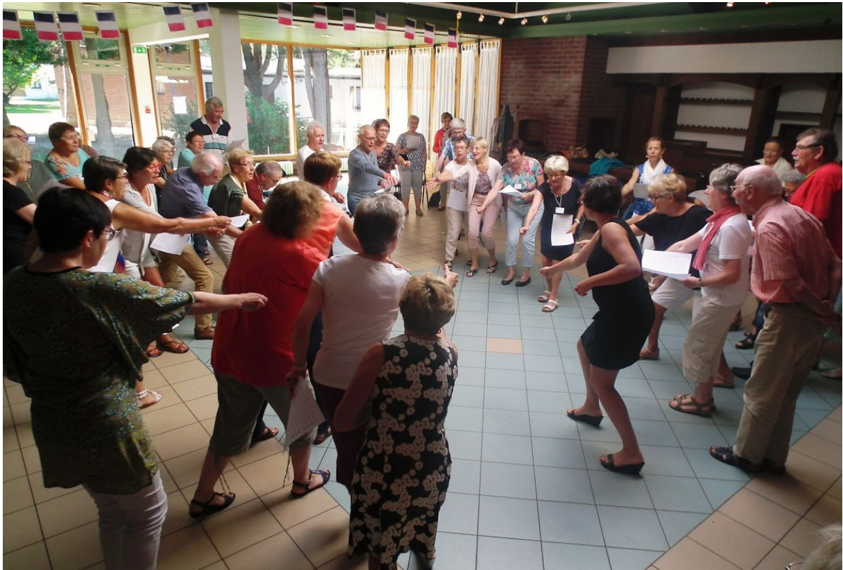
Répétitions en mouvement !