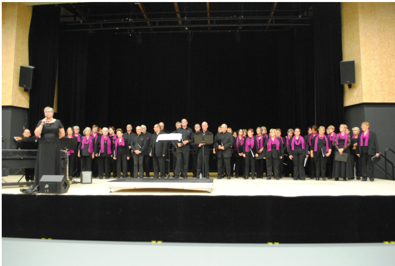
Concert à Coquelles le 17 décembre 2016