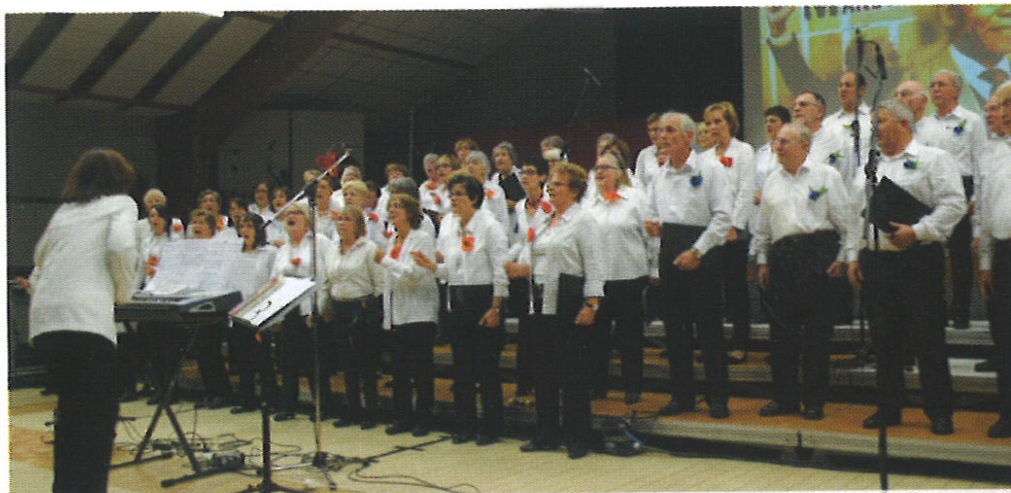
Le concert annuel a réuni la soixantaine de choristes.

La salle de la Maison du Parc a une nouvelle fois fait le plein le samedi 17 octobre pour le concert annuel du chœur. Avec le thème "Ils ont tant lutté" se rapportant à lutte permanente des hommes pour la liberté, les chanteurs ont su séduire leur public. Le groupe R'métic est venu clore la soirée.