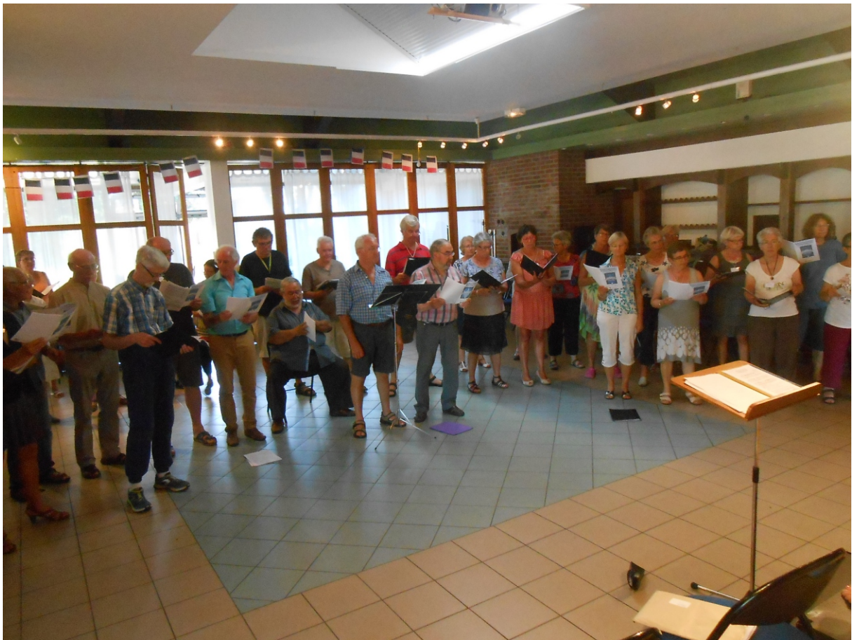
Répétitions debout....de face et de ....dos