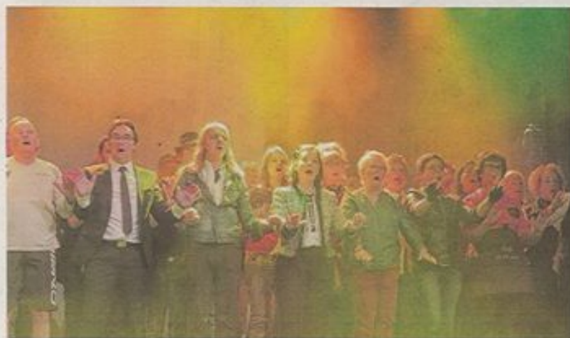
Tout en changeant maintes fois de costumes, chaque choriste a incarné une personne, tout au long du spectacle.

L'ensemble vocal de 60 âmes a ouvert la saison de ses dix ans, samedi à Billy-Montigny, par une représentation unique de son spectacle « Zoom ». Punch, émotion et délicatesse. Un triomphe.