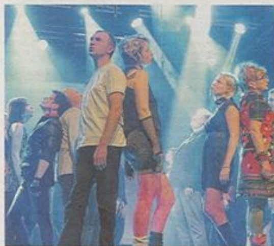
Chorégraphies et lumières très étudiées, comme ici pour « Prendre racine » de Calogero.