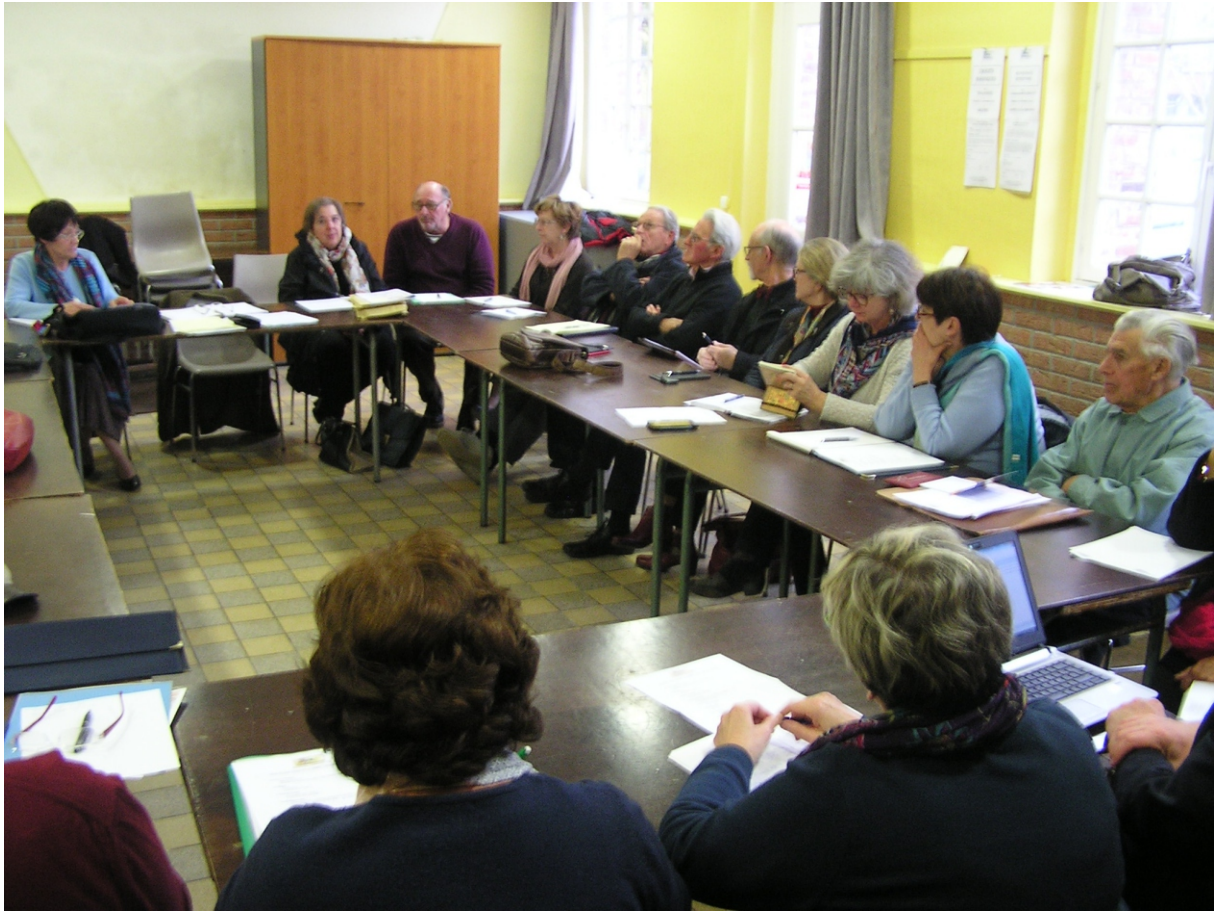
Conseil d'administration du 5 novembre 2016 à Aire/Lys