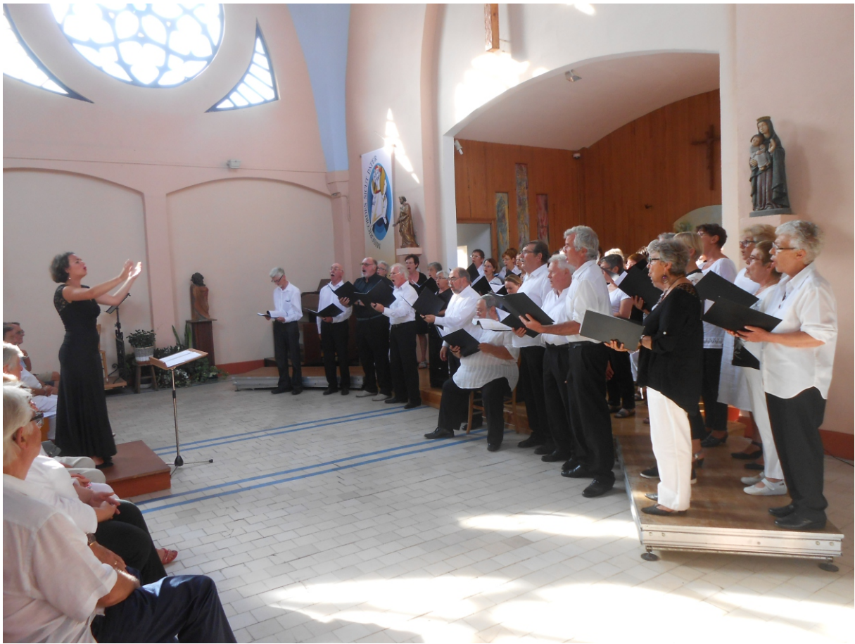
Concert à Merlimont le 27 août 2016